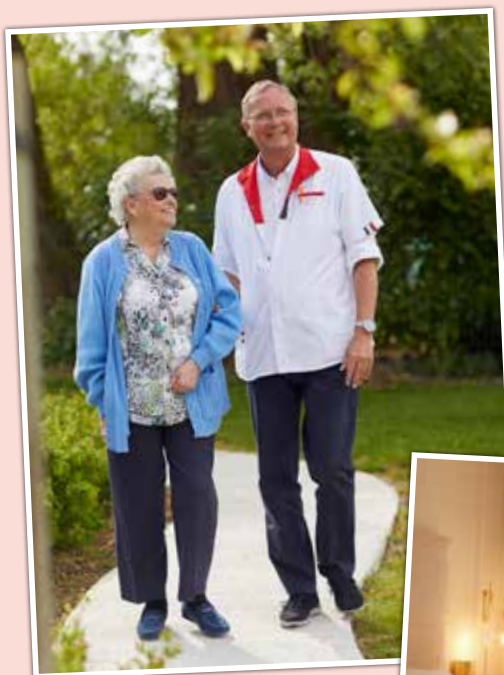
Arm in arm wandelen.