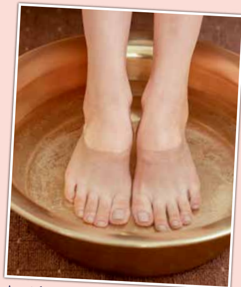
Amai dat doet deugd!