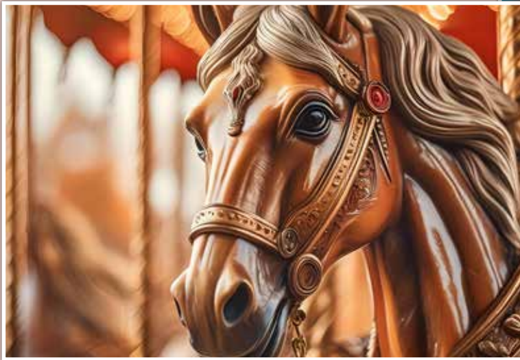
Samen naar de kermis, net als vroeger.