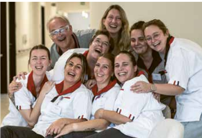
'We zijn een super team. We lachen heel wat af. Ook samen met onze bewoners!'

De afgelopen maanden werden twee nieuwe huizen plechtig geopend. En intussen is het in beiden al gezellig druk.