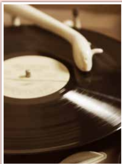
Fietsen met Yves Montand.

‘Een verzorgster merkte dat ik altijd droge handen had. En zonder dat ik ernaar vroeg, gaf ze mij een tube handcrème. Dat vond ik zo lief. Ik gebruik ‘m nu elke dag.’