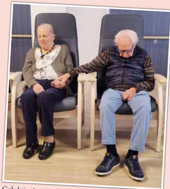
Geluk in Aquamarijn.