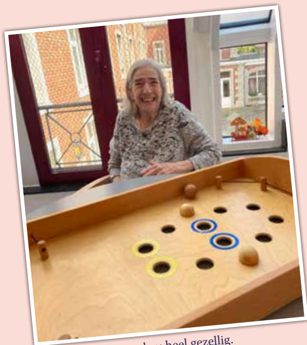
Samen spelletjes spelen: heel gezellig.