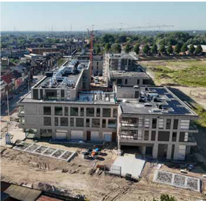
Zo zag Aan de Schelde er deze zomer nog uit. Het 8 hectare grote parkdomein is nu in volle aanleg.